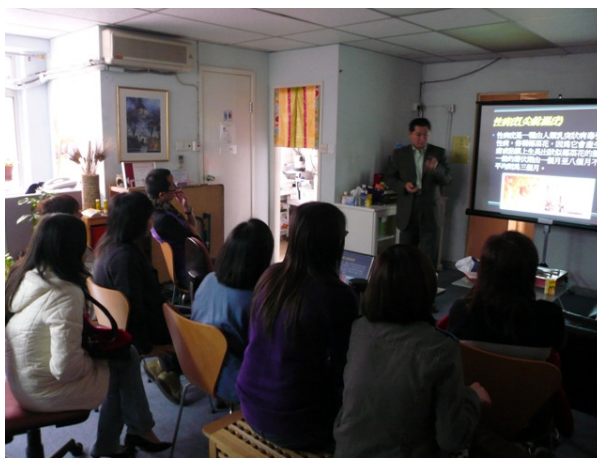
(關於愛滋病及性傳染病之講座)

其他活動還包括生日會、聖誕節(19/12/07)及農曆新年慶祝活動(22/2/08)、參觀電視城、烹飪班、瑜珈班、及自衛術班等。