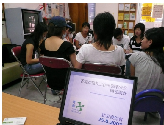
(上圖:2007 年 8 月 25 日記者招待會;

其後，亦有不同媒體就專題報導、立法會選舉特輯及劇本製作等，向青鳥及性工作者提出訪問要求，而我們都會在能否如實反映性工作者處境、是否尊重被訪者意願與保障其私隱的原則下，作出考慮。