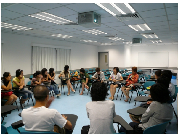
(「認識社群·宣揚人權」社區共融計劃)

2007年7月及8月，青鳥舉行「認識社群·宣揚人權」社區共融計劃（獲公民教育委員會贊助），透過五節工作坊與參加者一同探討人權概念、了解性工作者面對的人權議題，及後並於國際人權日及世界愛滋病日舉行公眾教育活動。